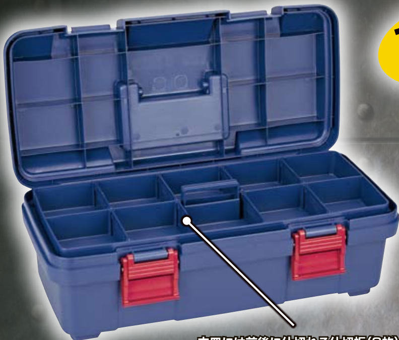
中皿には前後に仕切れる仕切板(8枚)付。