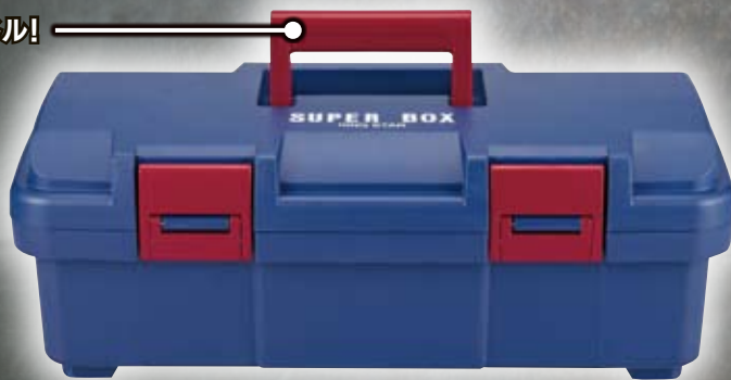
持ちやすいワイドハンドル!